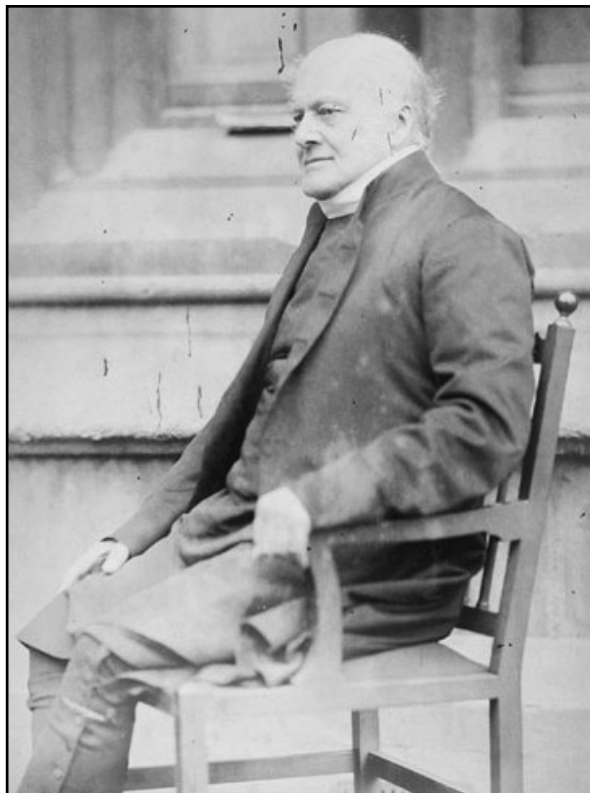
Charles Longley, 92nd Archbishop of Canterbury

Williams Colenso quien aunque había hecho una gran obra entre los zulúes causó la ira del arzobispo por sus opiniones innovadoras sobre la investigación bíblica. En un asombroso anticipo a las actuales circunstancias, el arzobispo declaró que Colenso era un hereje y envió a un nuevo obispo a servir en el área. Colenso no cedió ni entregó la diócesis y hasta ahora es muy reverenciado por la Iglesia en Sudáfrica.