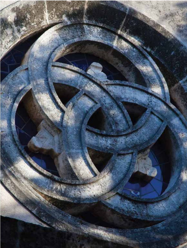
Amigos de la Iglesia Episcopal de Cuba