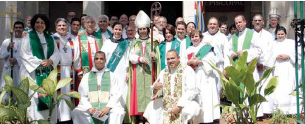
La Iglesia Episcopal en Cuba celebró su Sínodo General anual en La Habana del 21 al 23 de febrero de 2014 y adoptó un plan estratégico de tres años.

The Episcopal Church in Cuba held its annual General Synod in Havana on February 21-23, 2014, and adopted a three-year strategic plan.