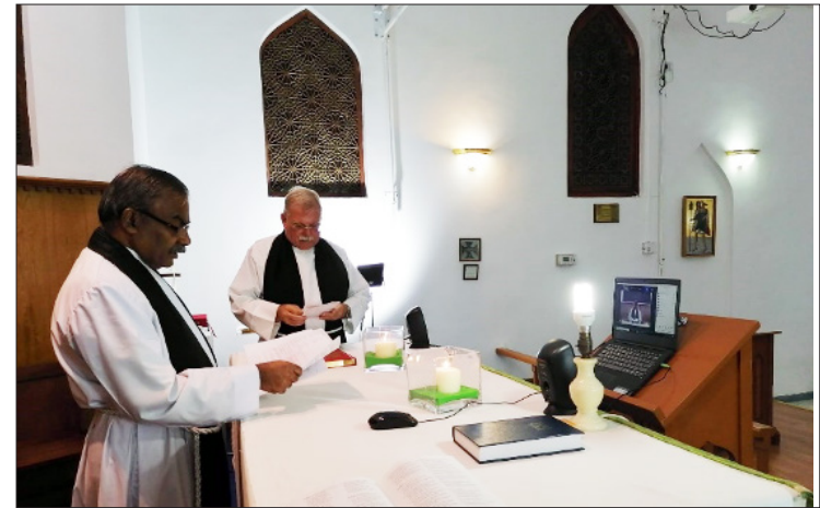
Adoración durante la pandemia en la Catedral San Cristóbal en Bahrein. Obsérvese la computadora portátil en el atril.

Sin una presencia cristiana viva, el cristianismo en Oriente Medio se convertirá en una colección de museos, en vez de tener una presencia vibrante y vital de cristianos cuya tradición de fe se remonta al primer Pentecostés. La Ofrenda del Viernes Santo es una expresión de nuestra solidaridad con nuestros hermanos y hermanas en Cristo que mantienen viva la fe en toda Tierra Santa.