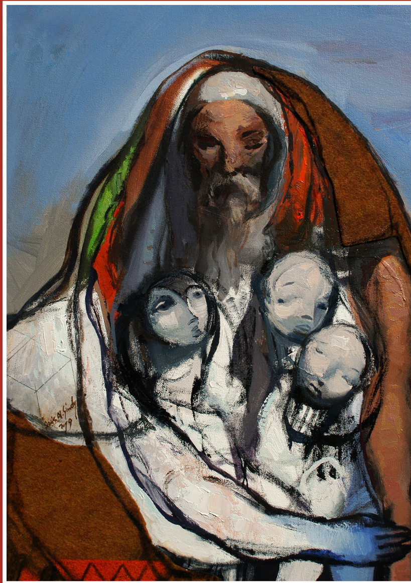
Le Compatissant, Par Qais Al Sindy, 2019

Alors que nous entamons un deuxième siècle de soutien aux ministères vitaux de la province anglicane de Jérusalem et du Moyen-Orient, nous nous rappelons - selon les mots de l'auteur Barbara Johnson - que « nous sommes des gens de Pâques vivant dans un monde de Vendredi saint. » Vos dons en ce jour poignant du calendrier ecclésiastique apportent un renouveau et une nouvelle vie à ceux qui vivent et servent là où Jésus a marché.